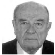
Του Τάκη Παναγιώτη Παπαδημητρίου

Από τα παλιά χρόνια η «κρίση», τα «δάνεια», οι «μεταρρυθμίσεις», οι «επενδύσεις» και τα άλλα συναφή φρούτα που ... αφθονούν στους μέρες στους, έδιναν και έπαιρναν. Παράλληλα η ανικανότητα των πολιτικών, η ανεπάρκεια της Δημόσιας Διοίκησης, η διαφθορά, ο χρηματισμός, το κλέψιμο, η δωροδοκία και ο πλουτισμός άχρηστων ορισμένων νεοπαράδοχων που αναδείχθηκαν στην ελληνική κοινωνία, ένεκα θέσης και ... υπο-