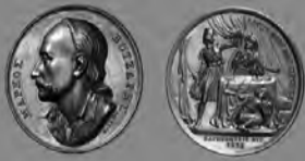
Χάλκινο μετάλλιο προς τιμήν του Μάρκου Μπότσαρη έργο του Konrad Lange (1836) SP65 PCGS, Wurzach-014, 44mm.

Από μια ενδιαφέρουσα και σπάνια σειρά από 12 μετάλλια που δημιουργήθηκαν με την εντολή του γιου του βασιλιά Όθωνα και της βασίλισσας Αμαλίας το 1836.